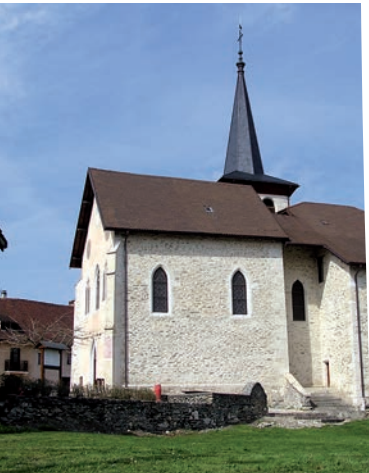
Eglise de Dullin. C.Maurel