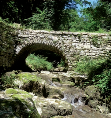
Pont de Téloncin. C.Maurel