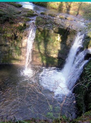
Cascade du Rondelet. C.Maurel