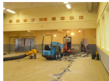
Travaux impressionnants ci-dessus

Ces travaux ont permis de refaire entièrement le carrelage, et aussi d'agrandir d'environ 80 m 2 cette salle, après la démolition des deux estrades béton intérieures, situées au droit des murs de façades. Les issues de secours ont été remplacées et les RIA (robinets d'incendie armés) mis aux normes. Les portes de communication entre le hall d'entrée et la salle ont été remplacées par une porte coupe-feu. Un nouveau bar d'occasion a trouvé sa place, avec aussi une partie réservée aux personnes à mobilité réduite. La petite cuisine a été totalement démolie afin d'obtenir une pièce de 27 m 2 . Elle est meublée avec une plonge lave vaisselle, frigo, et tables de préparation en inox. La porte entre la cuisine et la salle a été remplacée par une porte coupe feu. Un grand merci à tous nos employés communaux qui, sous la direction de Daniel Duval, ont aussi réalisé des travaux multiples en parfaite coordination avec les autres entreprises qui travaillaient sur le site : travaux de petite démolition, plâtrerie, peinture, électricité, faux plafond, menuiserie, maçonnerie, évacuation d'eaux usées. Et bravo à Roger Bovagnet-Pascal, 1 er adjoint qui a mené de main de maître ce chantier depuis les plans jusqu'à la réalisation finale en coordonnant les différents corps de métier et en suivant avec rigueur et compétences les différentes phases de travaux.